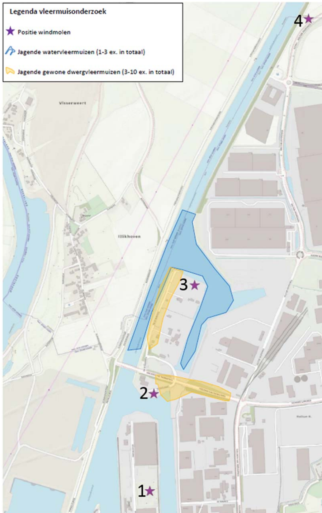
Figuur 3-1 Onderzoeksresultaten vleermuisonderzoek Ecolybrium 2018 (dit onderzoek is uitgevoerd voor 4 windturbinelocaties, na afronding van dit onderzoek is locatie 4 afgefallen)