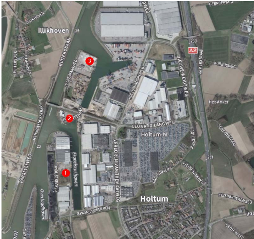
Figuur 2-1 indicatieve aanduiding beoogde locaties van de 3 windturbines (rode stippen)

Het voorgenomen plan omvat het realiseren van 3 windturbines met een totaal vermogen van circa 12 MW. Om de milieu-invloeden te kunnen bepalen wordt als voorbeeldtype de windturbine van Vestas V150 gehanteerd. De masthoogte van deze turbines bedraagt 123 meter en een rotordiameter van 150 meter. De tiphoogte (maximale hoogte) bedraagt maximaal 200 meter. De turbinespecificaties zijn weergegeven in tabel 2-1.